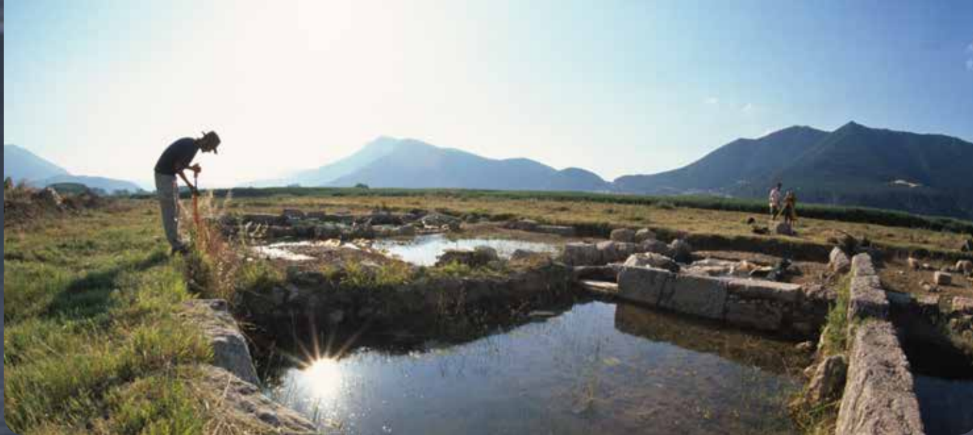
Αρχαιολογική έρευνα στη λίμνη Στυμφαλία.

Η έννοια των οικοσυστημικών υπηρεσιών φαίνεται να είναι μία δυναμικά ισχυρή ιδέα για την καθοδήγηση της ολοκληρωμένης ανάπτυξης, καθώς και της ανάπτυξης δίκαιων στρατηγικών και πολιτικών αποφάσεων για την πρόσβαση στους φυσικούς πόρους και τη διαχείρισή τους.