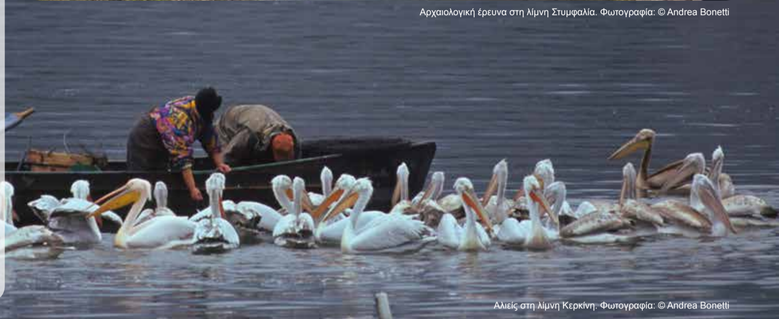
Αλιείς στη λίμνη Κερκίνη.