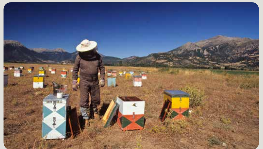
Μελισσοκόμος κοντά στη λίμνη Στυμφαλία.

Η καλή κατάσταση των οικοσυστημάτων σχετίζεται άμεσα με την ικανότητά τους να παρέχουν αντίστοιχα οικοσυστημικές υπηρεσίες.