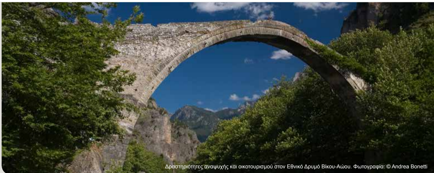
Δραστηριότητες αναψυχής και οικοτουρισμού στον Εθνικό Δρυμό Βίκου-Αίου.

Συνεπώς, στόχος των οικοσυστημικών υπηρεσιών είναι η ανάδειξη της αξίας των οικοσυστημάτων, οικονομικής ή όχι, δηλαδή της αποτίμησής τους μέσω της χρήσης μιας μονάδας μέτρησης και παρακολούθησης.